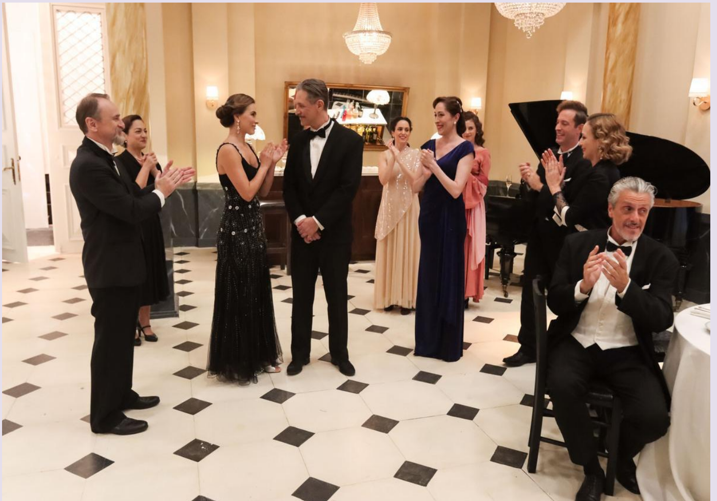
Σκηνή από επίσημη δεξίωση των «Πανθέων» στο ξενοδοχείο της Νίνας.