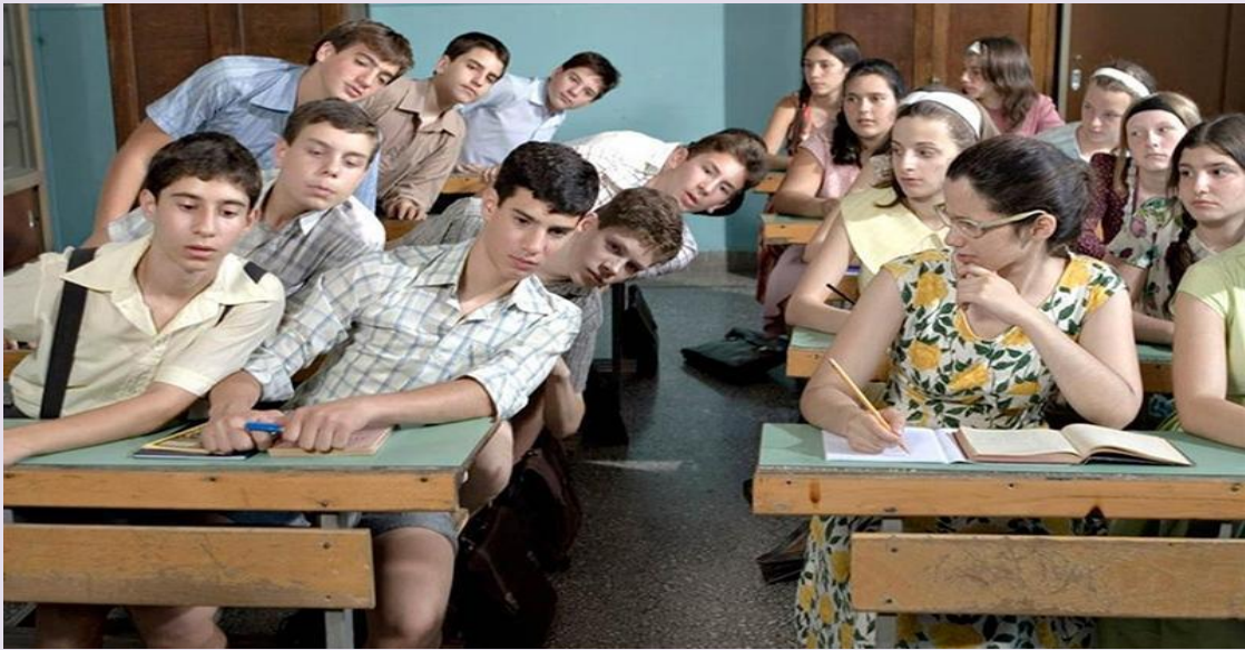
Στο σχολείο - σκηνικό του Αντώνη Χαλκιά στην ταινία «Η χορωδία του Χαρίτωνα» (2005) του Γρηγόρη Καραντινάκη