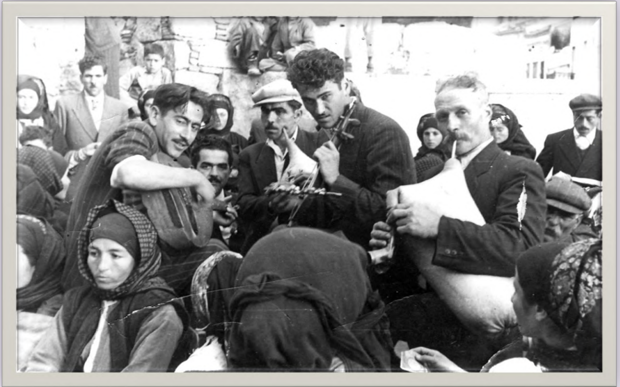
Το ολυμπίτικο γλέντι (Κάρπαθος)