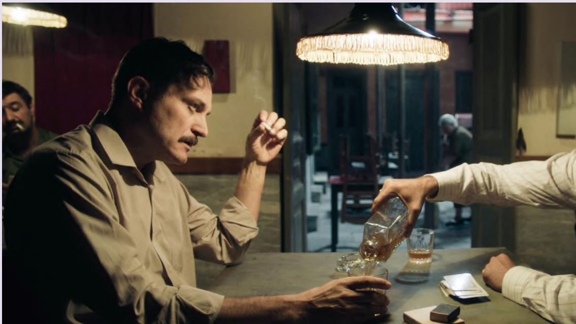
Ο πρωταγωνιστής Γιώργος Καραμύχος στο σκηνικό του Αντώνη Χαλκιά

Η συνέχεια από «Το Νησί» → η πρόσφατη τηλεοπτική δουλειά του Αντώνη Χαλκιά «Μια νύχτα του Αυγούστου»