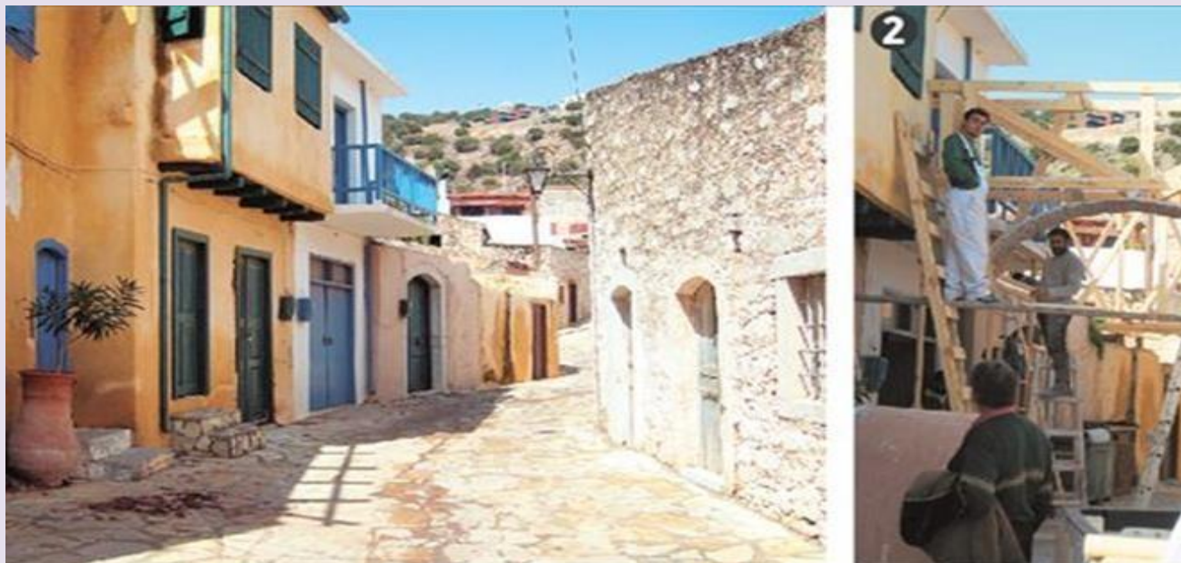
Το ισόγειο στον κεντρικό δρόμο της Επάνω Ελούντας (φωτογραφία αριστερά) όπως μεταμορφώθηκε σε καφενείο της τηλεοπτικής Σπιναλόγκας από τον Αντώνη Χαλκιά για τις ανάγκες της σειράς του Mega «Το Νησί» (δεξιά). Ο σκηνογράφος Αντώνης Χαλκιάς και οι συνεργάτες του έφτιαξαν από την αρχή όλα τα σκηνικά, ώστε να θυμίζουν την περίοδο από το 1939 έως το 1957.