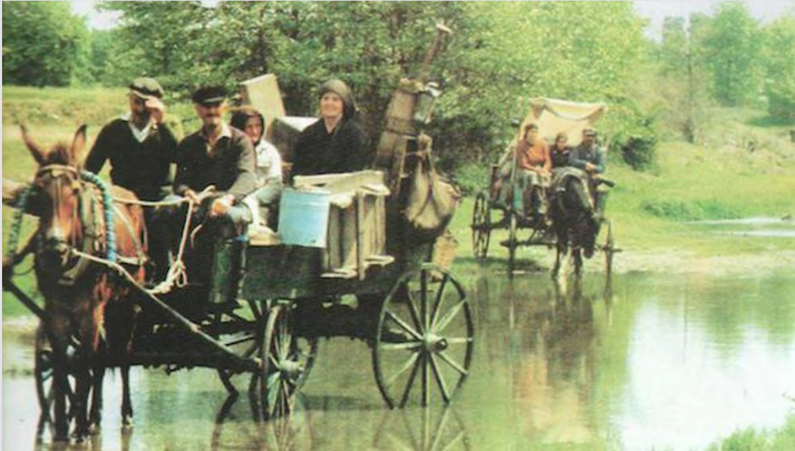
Η ταινία «Καραβάν Σαράι» (1986) σε σκηνοθεσία Τάσου Ψαρρά και σκηνογραφία Αντώνη Χαλκιά Βραβείο Σκηνογραφίας στο 27ο Φεστιβάλ Κινηματογράφου Θεσσαλονίκης.

Ο σκηνοθέτης του «Καραβάν Σαράι» Τάσος Ψαρράς θυμάται: «Ήταν μια μεγάλη παραγωγή για την εποχή του, το 1986, ίσως και για σήμερα. Έλαβαν μέρος 80 ηθοποιοί και πάρα πολλοί φιγγυράν. Στα γυρίσματα της Ελευθερούπολης είχαμε ημερησίως 80 με 90 κάρα, άλλα τόσα και παραπάνω ζώα, και 400 με 500 κομπάρσους.