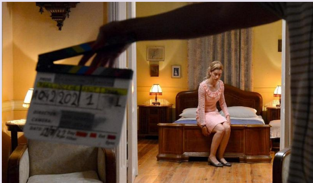
Σκηνή από τα γυρίσματα